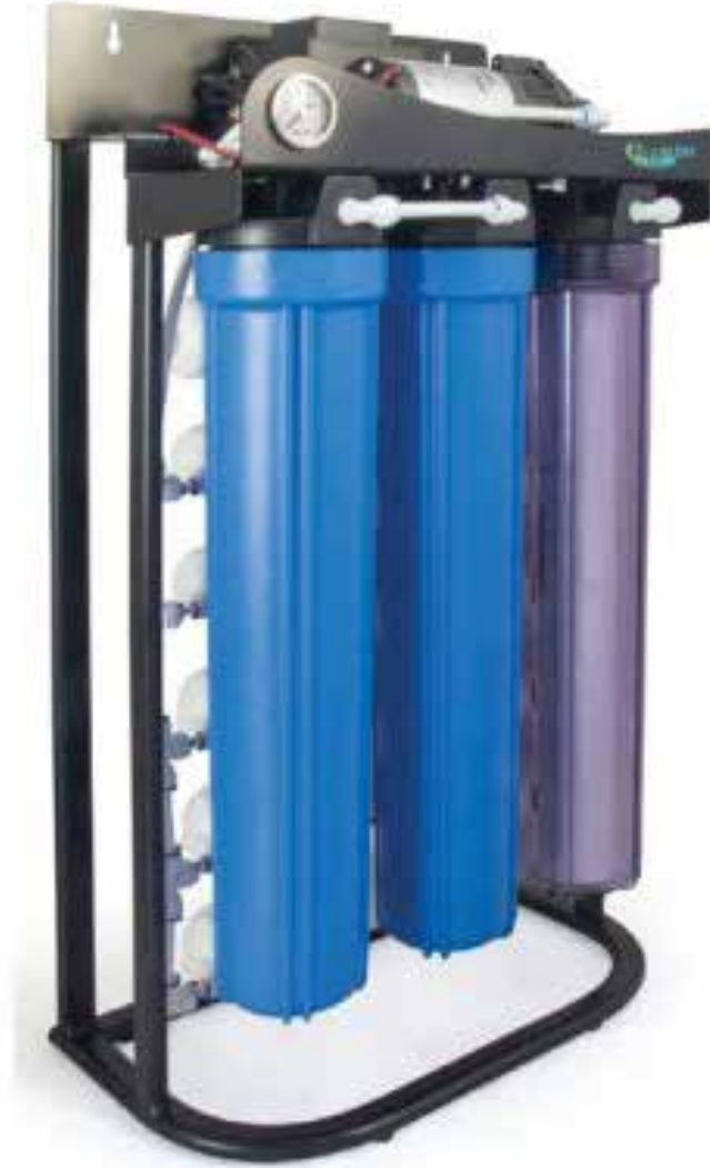
Abway RO 20/30/40/50