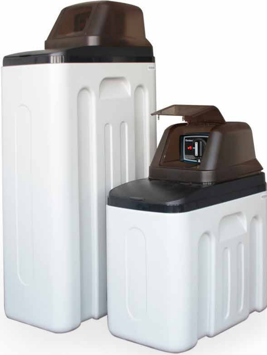
ABWAY Mini Kabin