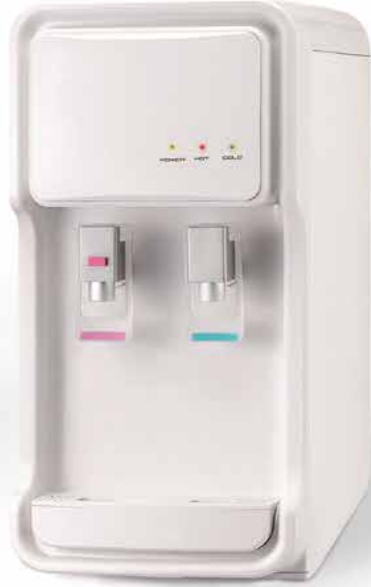
Mini AK Sebil